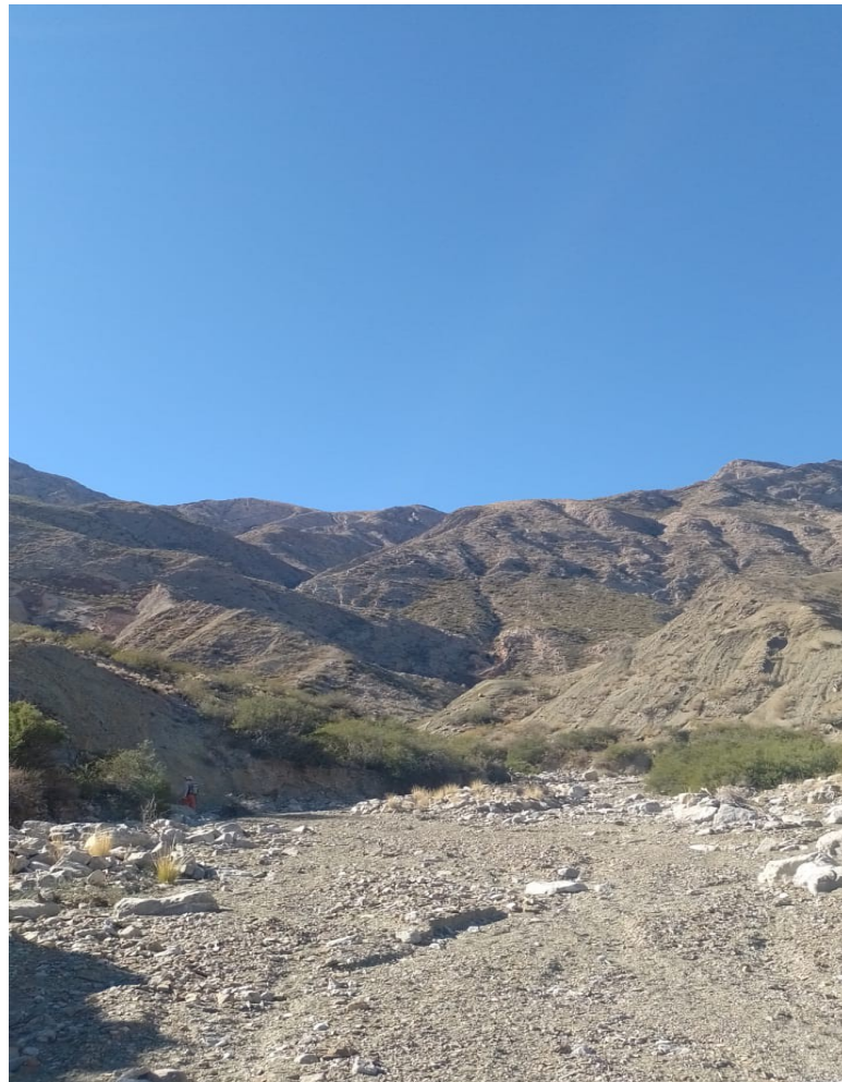
Panorámica de la zona de trabajo