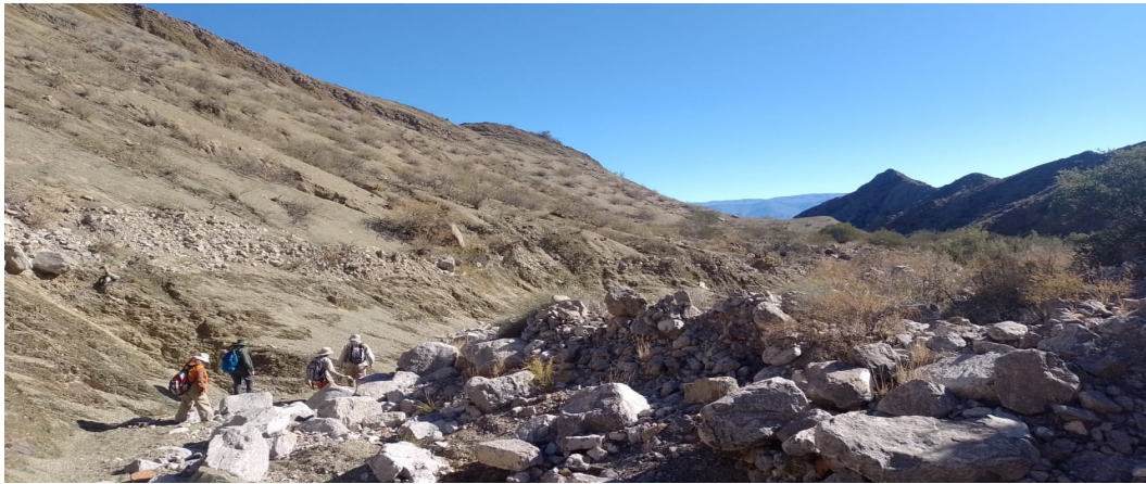
Llegada del grupo de trabajo a la zona de estudio