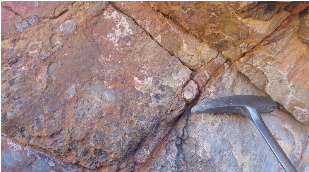
conglomerado basal Fm La Chilca