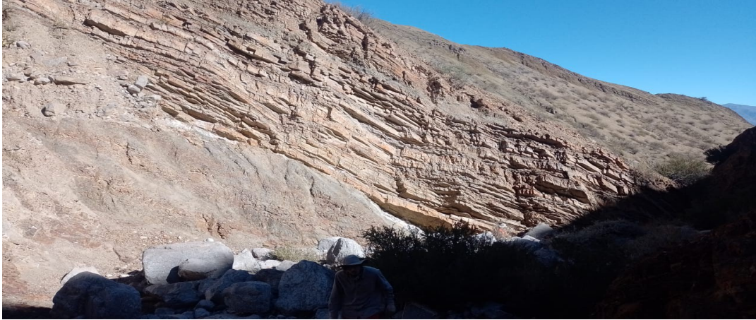
Vista Norte de la Quebrada , Fm. La Chilca