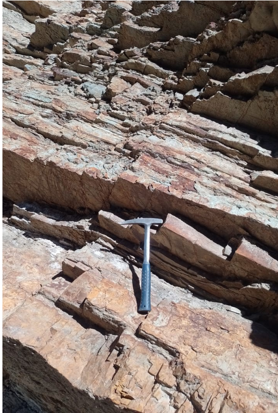
Estratos de la base de la Fm La Chilca